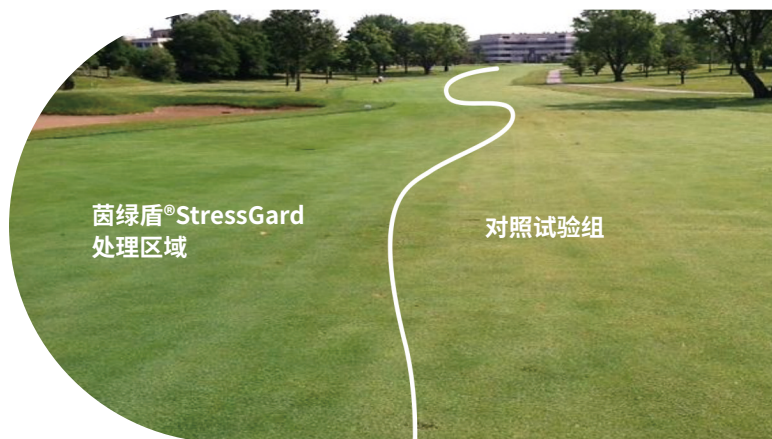
Poplar Creek 高尔夫球场, 伊利诺伊州